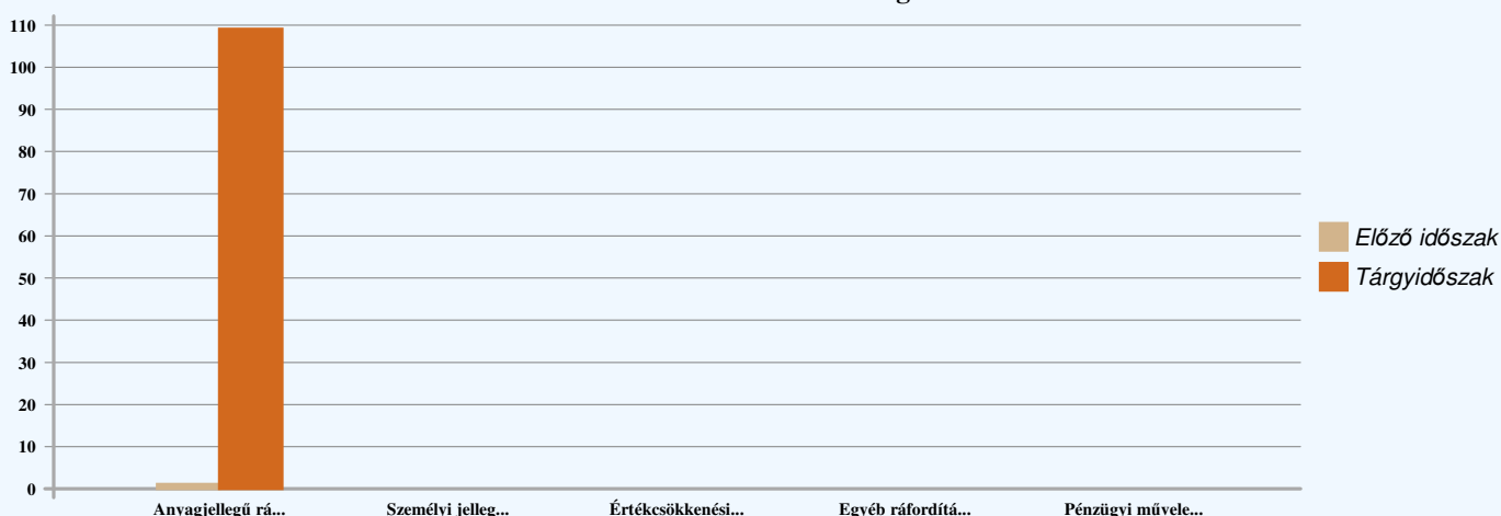
Ráfordítások alakulása és megoszlása